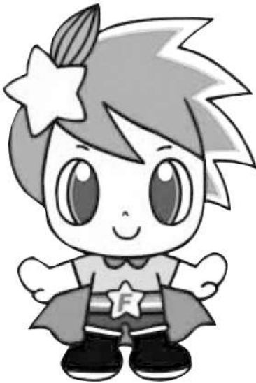
福生市社会福祉協議会のキャラクター「福丸」