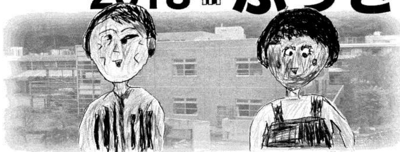
たましろの郷のなかまが描いた絵です。